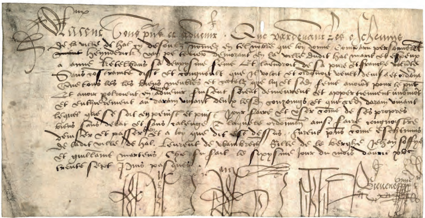
Afb. 3. Particuliere akte op perkament, type chirograaf, Halle, 6 april 1537. Indien u deze netjes geschreven tekst kan lezen, verzoeken wij u dringend ons team transcribenten te komen versterken.

Die oproep blijft uiteraard onverminderd van kracht, reden waarom ik hem hier nogmaals expliciteer: heeft u nog oude handschriften in uw bezit m.b.t. Halle, Lembeek of Buizingen, contacteer dan a.u.b. de KGOKH zodat de historische informatie die erin schuilgaat niet verloren raakt. Een onogelijk snippertje perkament, een weerbarstig rolletje papier of... de Halse tegenhanger van de Rechtvaardige Rechters? Aarzel niet! Wij zorgen ervoor dat het in optimale omstandigheden bewaard wordt in den AST of in het Rijksarchief, nadat we het zorgvuldig gerestaureerd en gedigitaliseerd hebben. Dergelijke akten, charters, oorkonden... zijn ongetwijfeld curieuze dingen, maar niemand heeft er wat aan als ze in lades en kasten stof liggen te vergaren. Ze zijn geschreven in een nage-